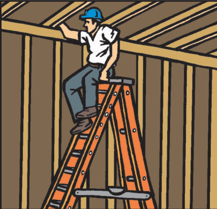
INCORRECTO: Jamás se siente o se pare de espaldas en una escalerilla

Desempeñar tareas simples pueden convertirse extremadamente peligrosas al trabajar desde posiciones elevadas. Aunque las escalerillas son herramientas de fácil uso y requieren de muy poco entrenamiento para asegurarse de que se colocan correctamente, los electricistas deben cerciorarse que se usen correctamente. En demasiadas ocasiones es más fácil sentarse en la parte superior de éstas en lugar de estar parado o bajarse de la escalerilla para cambiar de posición. Además, a menudo evitan invertir el tiempo y esfuerzo necesarios para obtener una escalerilla de extensión en lugar de usar la escalerilla de peldaños plegable en posición cerrada. Ambos ejemplos son violaciones comunes en el uso seguro de escalerillas.