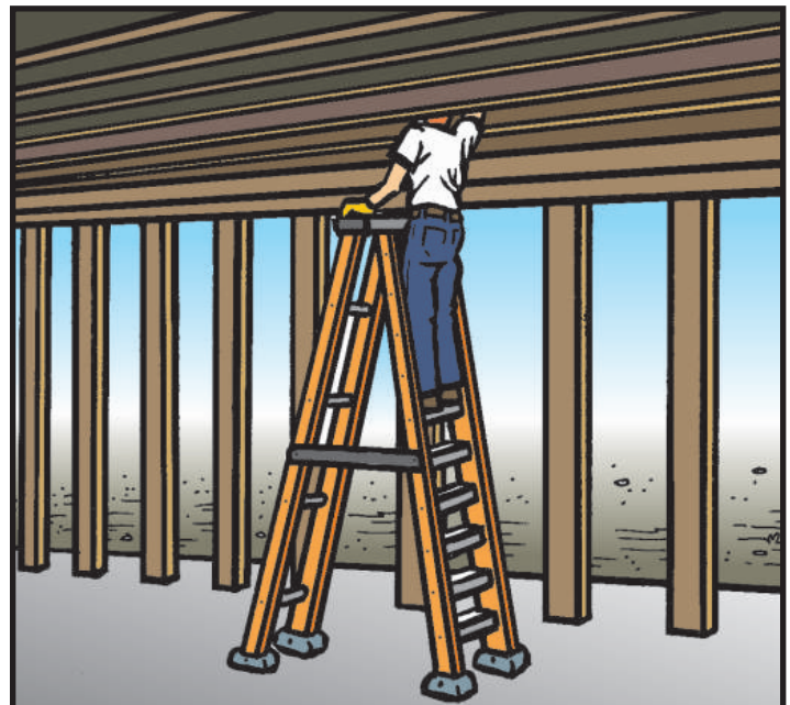
CORRECTO: Uso apropiado de una escalerilla