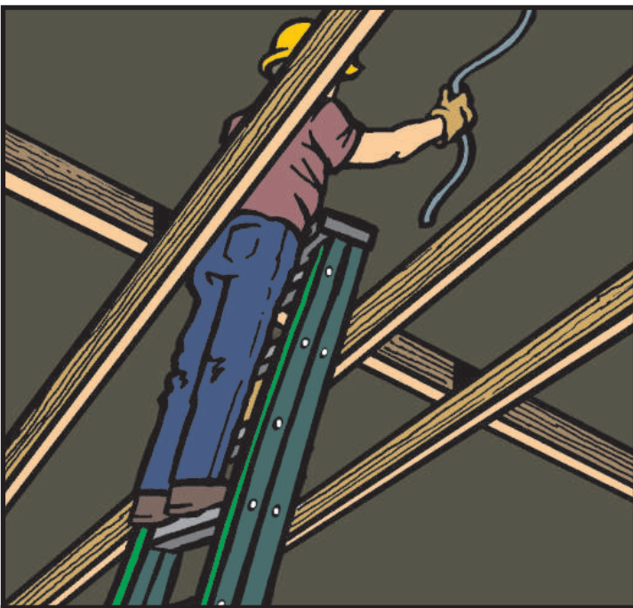
INCORRECTO: Jamás use una escalerilla plegable como escalerilla de extensión

29 CFR 1926.1060 (a) El patrón deberá proporcionar un programa de capacitación para cada empleado utilizando escalerillas